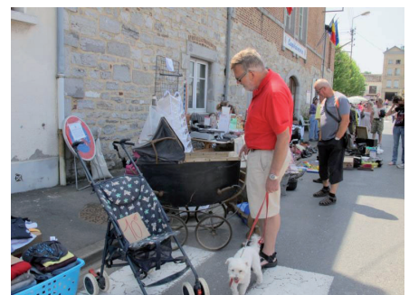
Markt in Givet