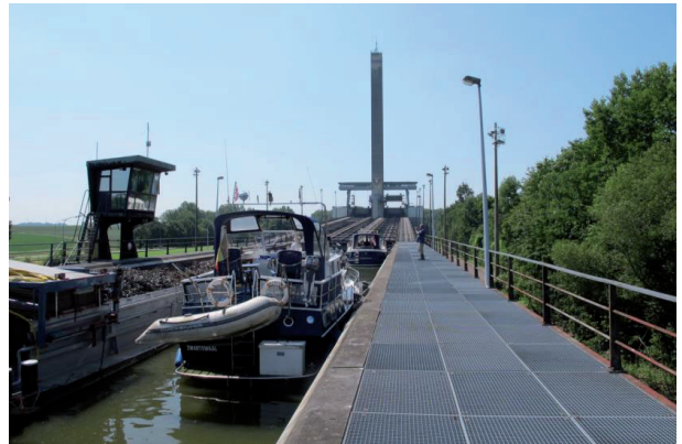
Hellend vlak van Ronquières