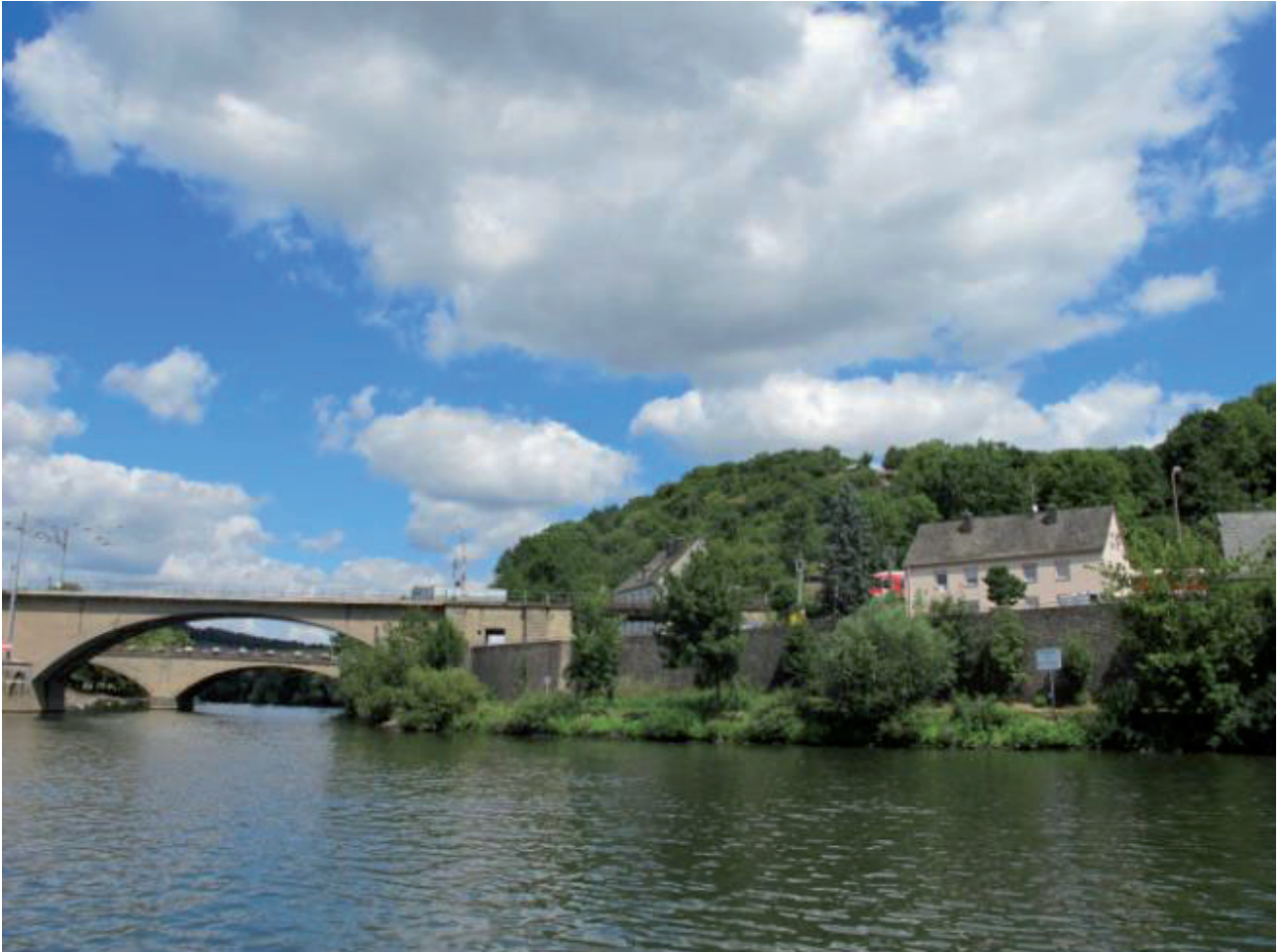
Grens tussen Luxemburg en Duitsland

Hoewel ons doel is de Moezel bezoeken en ervaren, zijn we blij dat we in Toul, waar onze geplande Moezeltocht in Frankrijk begint, besloten hebben om naar Nancy te varen. We hoorden dat het sinds enige jaren mogelijk is om via het Marne-Rijnkanaal, het Saarkanaal en de Saar naar de Moezel te varen. Belangrijker: we vernamen dat deze vaarroute waarschijnlijk weer dicht gaat. Wij besluiten: wij zijn er nu, we hebben de tijd, wij gaan de Saar bevaren. Daar hebben we geen minuut spijt van gehad!!!! Er was één klein probleem: de Saar komt vlakbij Trier, in Duitsland, in de Moezel. En we wilden zo graag ook langs Luxemburg varen. Daarom varen we één deel twee maal: het stukje Moezel langs Luxemburg. Eerst naar beneden (op) en daarna weer naar het noorden (af).