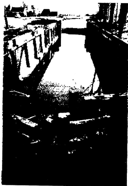
De Grachtsluis verdient de monumentenstatus, stelt Waterschap Boarn en Klif.