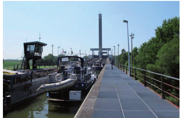
Hellend vlak van Ronquières