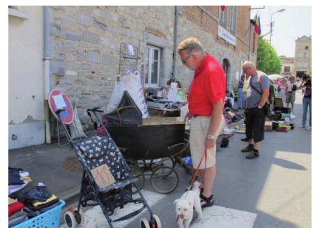
Markt in Givet