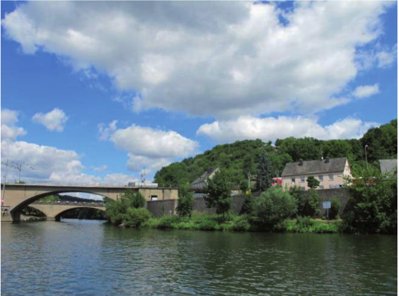
Grens tussen Luxemburg en Duitsland

Hoewel ons doel is de Moezel bezoeken en ervaren, zijn we blij dat we in Toul, waar onze geplande Moezeltocht in Frankrijk begint, besloten hebben om naar Nancy te varen. We hoorden dat het sinds enige jaren mogelijk is om via het Marne-Rijnkanaal, het Saarkanaal en de Saar naar de Moezel te varen. Belangrijker: we vernamen dat deze vaarroute waarschijnlijk weer dicht gaat. Wij besluiten: wij zijn er nu, we hebben de tijd, wij gaan de Saar bevaren. Daar hebben we geen minuut spijt van gehad!!!! Er was één klein probleem: de Saar komt vlakbij Trier, in Duitsland, in de Moezel. En we wilden zo graag ook langs Luxemburg varen. Daarom varen we één deel twee maal: het stukje Moezel langs Luxemburg. Eerst naar beneden (op) en daarna weer naar het noorden (af).