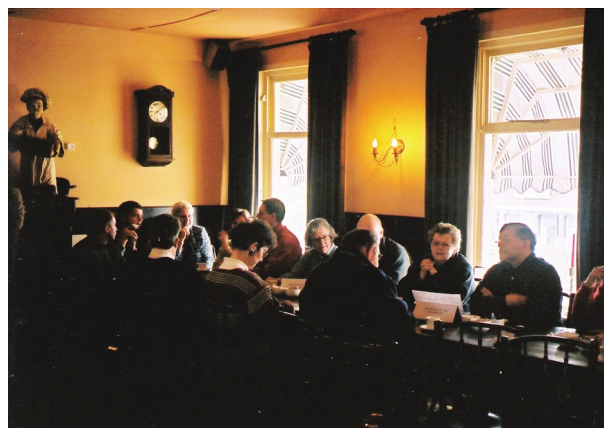
Zo is het begonnen. Deze foto is genomen op 13 februari 2000 tijdens de oprichtingsvergadering van De Kentenaren in café-restaurant De Watersport in Woudsend.