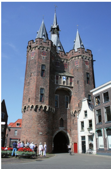
Bij de Sassenpoort

Als we allen weer zijn ingescheept worden om 15.20 uur de trossen losgegooid. De terugreis verloopt voorspoedig (alleen even wachten voor de brug in Zwolle) en om 16.45 uur nemen we onze ligplaats in aan de wal in De Molenwaard. Tuinstoelen, tafels en de partytent komen te voorschijn en we richten het grasveld in voor de barbecue. Slager Op de Weg uit Hasselt levert keurig op tijd de gasbarbecue, een keur aan vlees- en visgerechten, salades en stokbrood af.