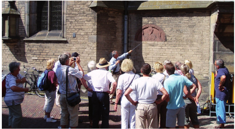
De gids heeft een aandachtig gehoor

Nadat we het gelag hebben betaald gaan we op zoek naar de gids van de VVV, die ons op onze toeristische wandeling zal begeleiden. Voor ons komt het slecht uit dat er kermis is in Zwolle. Zoals gebruikelijk gaat dat vermaak gepaard met nogal wat lawaai, met als gevolg dat de gids nauwelijks is te verstaan. Dat wordt pas beter als we uit de buurt van de Grote Markt zijn. Maar dan is de inleiding al aan velen voorbij gegaan. Het is ook jammer dat deze gids niet improviseert. Vanzelf denken we terug aan de gids van vorig jaar, die ons zo losjes door Hasselt leidde en smakelijk kon vertellen. Onder anderen over "die boeven van Zwolle". Pogingen om nu wat te horen over "die boeven van Hasselt" lopen op niets uit. Misschien waren die van Hasselt wel geen boeven. Of, wat waarschijnlijker is, de Zwollenaren hadden veel meer te stellen met hun concurrenten uit Kampen.