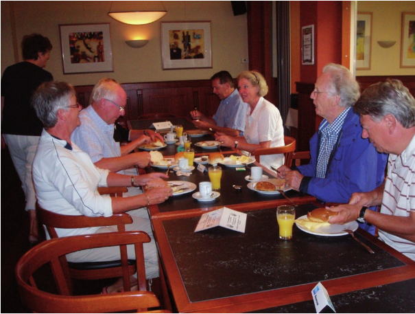
Ontbijt in "De Herderin"

Als een aantal Kentenaren (niet allemaal, want een deel maakt geen gebruik van het Euifeestontbijt) op zaterdagmorgen "De Herderin" binnenloopt, blijkt de waard woord te hebben gehouden. Er staat een tafel voor ons gereserveerd. Ook al zijn we er niet allemaal, we laten het ons goed smaken. Daarna gaan we weer terug naar de haven om te verzamelen voor de vaartocht naar Zwolle.