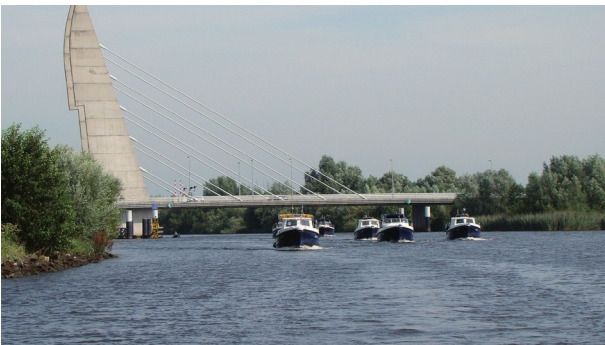
Zwolle, hier komen de Kentenaren!

Als een aantal Kentenaren (niet allemaal, want een deel maakt geen gebruik van het Euifeestontbijt) op zaterdagmorgen "De Herderin" binnenloopt, blijkt de waard woord te hebben gehouden. Er staat een tafel voor ons gereserveerd. Ook al zijn we er niet allemaal, we laten het ons goed smaken. Daarna gaan we weer terug naar de haven om te verzamelen voor de vaartocht naar Zwolle.