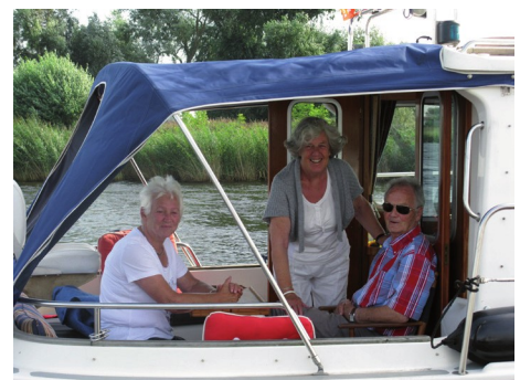
In de kuip

We zoeken eerst een gelegenheid om te lunchen. We kiezen een terras op de Grote Markt en genieten van heerlijke belegde broodjes.