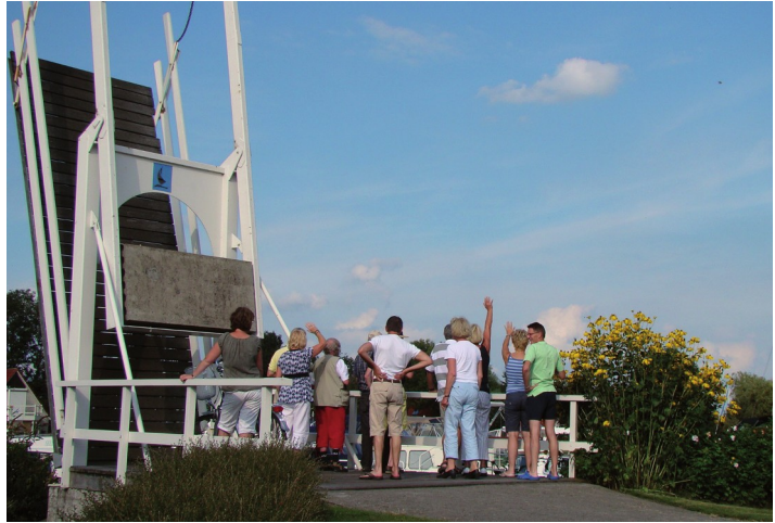
Daar komt weer een Kent aan!

Als het weekeinde op vrijdag 14 augustus echt begint is het stralend weer met een aangename temperatuur en zo zal het tot en met zondag blijven. Ook dat is niet anders dan vorig jaar. De Kentenaren staan bij de weergoden blijkbaar in een goed blaadje.