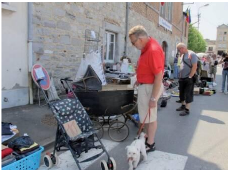
Markt in Givet

Hoewel ons doel is de Moezel bezoeken en ervaren, zijn we blij dat we in Toul, waar onze geplande Moezeltocht in Frankrijk begint, besloten hebben om naar Nancy te varen. We hoorden dat het sinds