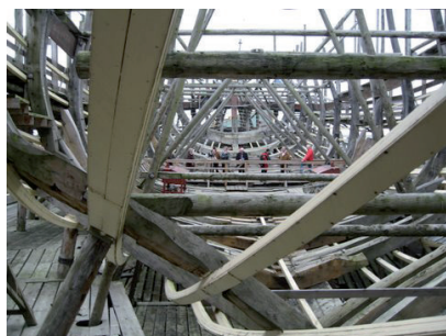
De Zeven Provinciën in aanbouw