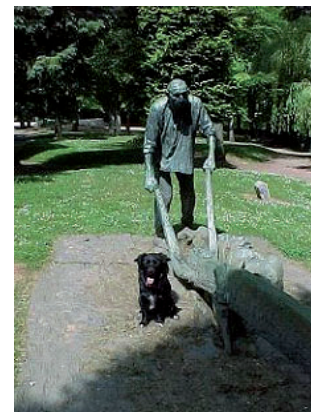
Blitz bij het beeld van een ploeger in het park van Charleville

7 juni. De panne aan de motor van de Doerak blijkt ernstiger dan voorzien. Op aandringen van onze vrienden gaan wij zonder hen verder met de tocht. We blijven vervolgens twee dagen in Charleville Mezières liggen. Volgens de havenmeester heeft Charleville het mooiste plein van Frankrijk. Wij vonden het, gezien deze uitspraak, een beetje tegenvallen. Wanneer we de volgende dag vertrekken geeft de eigenaar van een Barkas ons nog de tip mee dat tussen sluis 19 en 20 een leuk restaurant is met een lekker hapje eten.