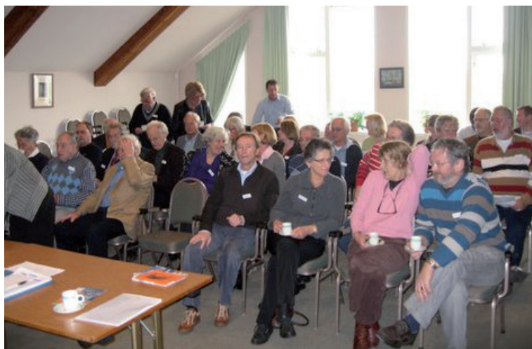
Een goed gevulde vergaderzaal

Na de rondleiding neemt een aantal leden nog een drankje in het restaurant als slotstuk van deze geslaagde voorjaarsbijeenkomst.