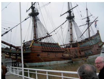
De Batavia aan de kade