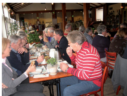
Lunch in Hajé De Taverne