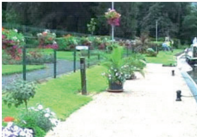
De haven van Revin

2 juni. Mooie tocht door de Ardennen naar Revin. Op dit traject kom je twee tunnels tegen die niet verlicht zijn. Je moet dus zelf bijschijnen met een breedstraler. De afstandsbediening werkt perfect tot de één na laatste sluis. We blijken er te snel ingevaren te zijn. Dus de volgende sluis rustiger invaren.