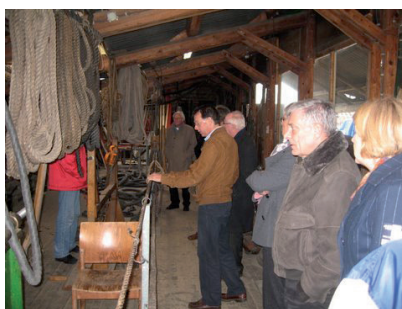
Rondleiding in de werkplaats