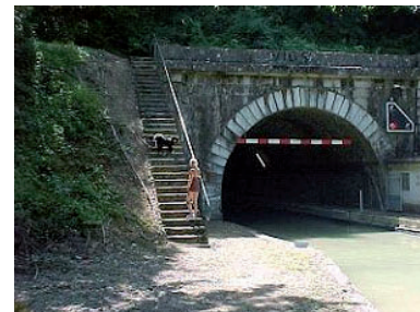
Tunnel de Mont-Billy

15 juni. We vertrekken om een uur of negen. Op dit traject is een lange Tunnel de Mont-Billy, die 2302 meter lang is. Het licht staat op rood omdat net voor ons een boot de tunnel ingevaren is. Dus houden we even pauze. Voor deze tunnel heb je geen zaklantaarn nodig. Na het invaren van de tunnel springen de lichten aan. Zo arriveren we na veertien sluisen en een tunnel in Condé sur Marne, wat een dood dorp is. De huizen liggen hier allemaal verscholen achter een hoge muur en iedereen lijkt er wel een hond te hebben. De kerk is prachtig, maar ook deze is onbereikbaar. Voor ons ligt een kermisachtige kruiser, met een grote Donald Duck op het voordek, omringd met kleine eenden en bloemen. Achterop hangt een brommer. Dit alles blijkt van een Nederlandse vrouw te zijn, die helemaal in haar eentje met haar hondje door Frankrijk trekt. Ze heeft motorpech, waarschijnlijk de koppakking. Heel sneu. Achter ons ligt een Noorse familie met hun zeilschip. Ze zijn vanuit Noorwegen op weg naar Zuid-Spanje. De mast is in Duitsland op transport gezet naar Zuid-Frankrijk. Ze hebben een zoon van twaalf jaar aan boord, die op de Globeschool zit en via internet zijn lessen volgt.