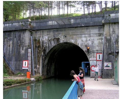
Tunnel de Mauvage

23 juni. Voor vertrek gaan we eerst bij de Aldi (die vlakbij is) boodschappen doen. Daarna gaat Rinus nog apart te veld voor brood en komt natuurlijk ook met een taartje terug. Na